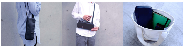
肩掛けスタイルとして