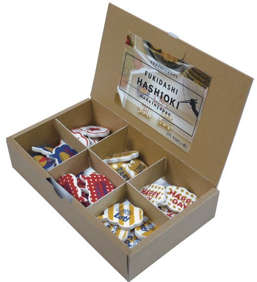
（正面） SIZE: W235mm×H135mm×D52mm（蓋を閉じた場合）