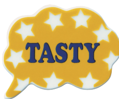
TASTY (テースティ) 品番：JA5811