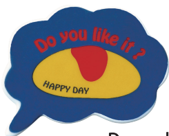
Do you like it? (ドゥユーライクイット?) 品番：JA5813