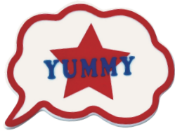
YUMMY (ヤミー) 品番：JA5810

■吹き出し箸置き 本体価格：¥500 / LOT：5 サイズ：約W50×H6×D40mm 素材：ニューボン 原産国：日本