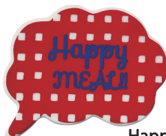
Happy meal! (ハッピーミール!) 品番：JA5814