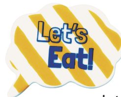
Let's Eat! (レッツイート!) 品番：JA5815