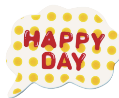
HAPPY DAY (ハッピーデー) 品番：JA5812